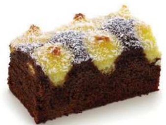
Chocolate y coco 2500g