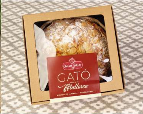
Mini gató de almendra 540g