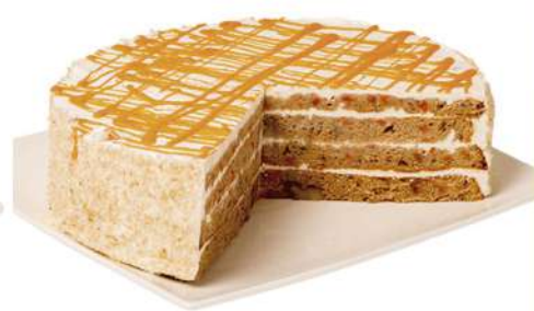
Carrot cake 2300g