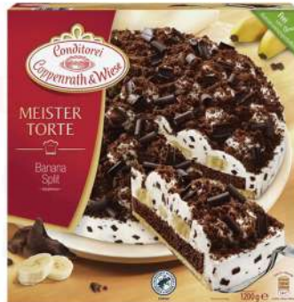
Banana split 1200g