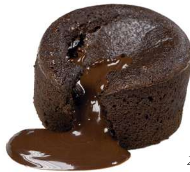
Coulant 90g 24 uds por caja