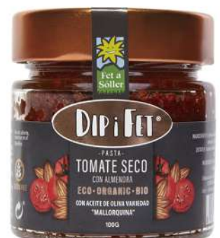
8436159642280 Pasta de tomate ECO Dip i fet 100g