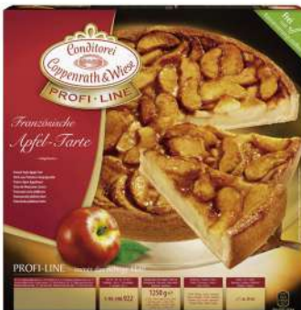
Manzana francesa 1250g