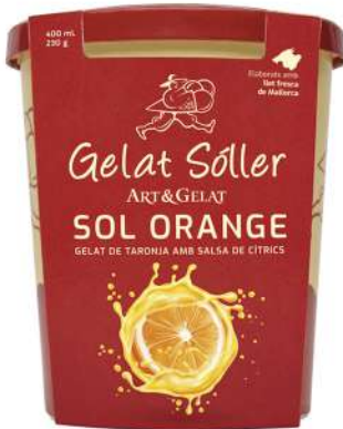
8436015962774 Sol Orange