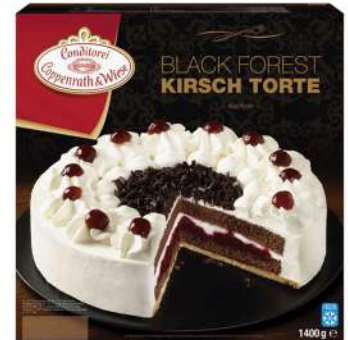
Selva negra 1400g