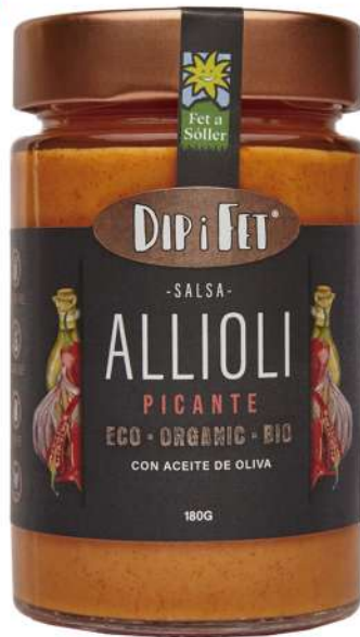
8436015964433 Allioli picant ECO Dip i Fet 180g