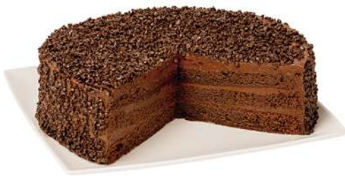
Muerte por chocolate 2350g