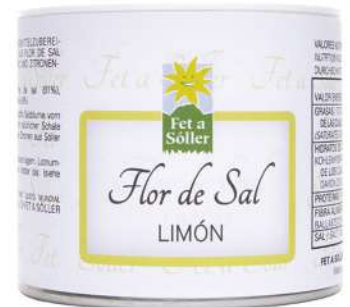
8436015963368 Flor de sal con limón ECO Fet a Sóller 100g