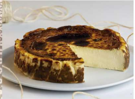
Queso vasca 2100g