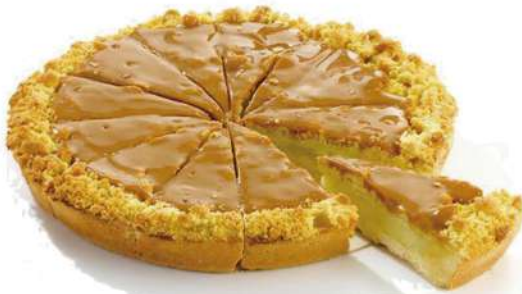
Manzana y caramelo 1800g