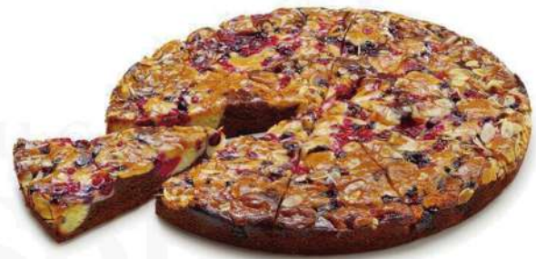
Frutos rojos y chocolate 1250gr