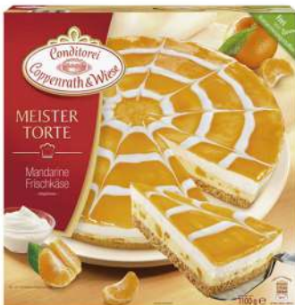
Queso y mandarina 1100g