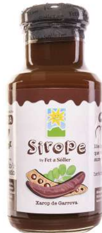
8436015965140 Algarroba 200ml