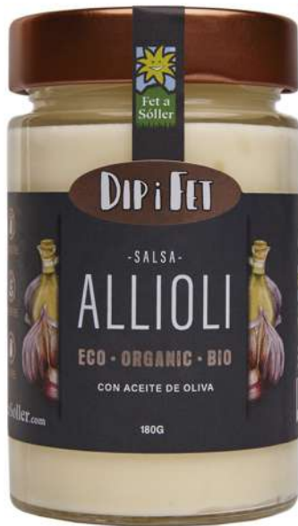
8436015964181 Allioli ECO Dip i Fet 180g