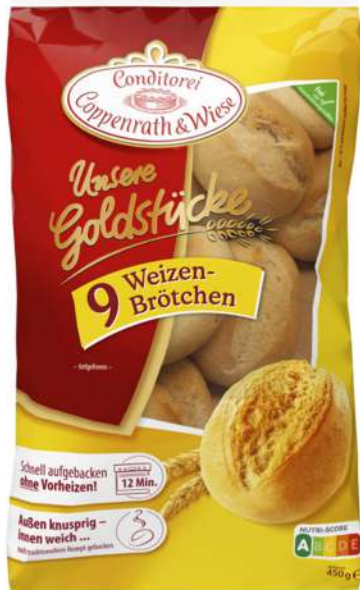
Blanco 9 uds