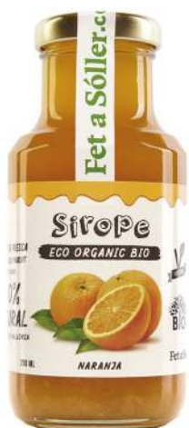
8436015963450 Naranja ECO 200ml