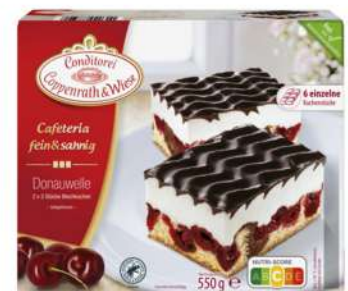
Cereza, nata y chocolate 6 porciones, 550g