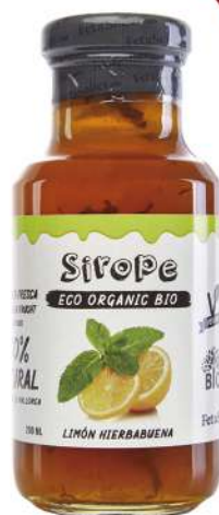
8436015963863 Limón-hierbabuena ECO 200ml