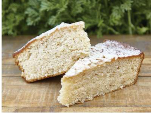
Gató de almendras 1200g