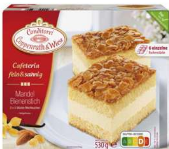
Almendra 6 porciones, 530g