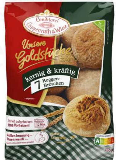
De centeno 7 uds

Panecillos individuales listos para hornear y consumir