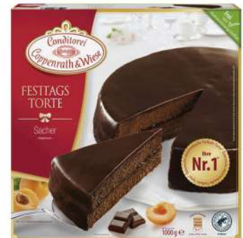
Sacher / Chocolate 1000g