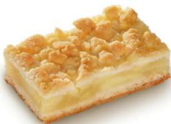
Crumble de manzana 2700g