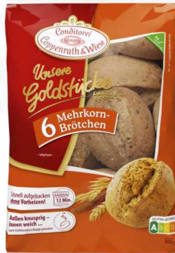
De espelta 6 uds