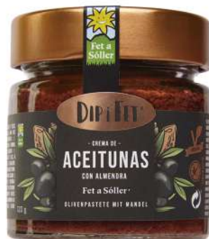
8436015964556 Crema de aceituna negra con almendra Dip i Fet 120g