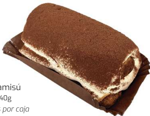
Tiramisú 140g 12 uds por caja