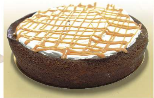
Tarta de zanahoria 1300g