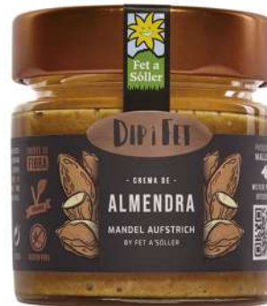
8436015964464 Crema de almendra ECO Dip i fet 110g