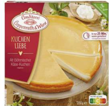
Queso fresco 1250g