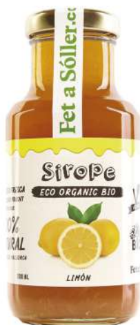
8436015963467 Limón ECO 200ml