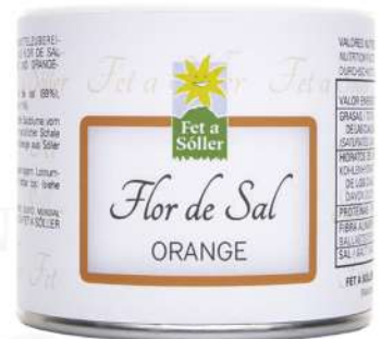
8436015963344 Flor de sal con naranja ECO Fet a Sóller 100g