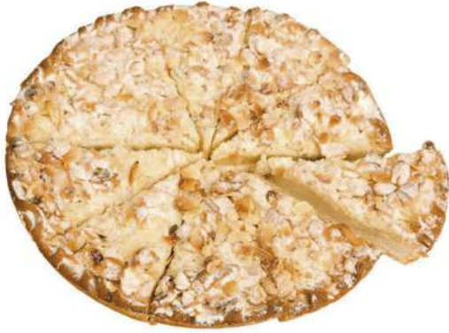
Manzana Bretone y almendras 1000g