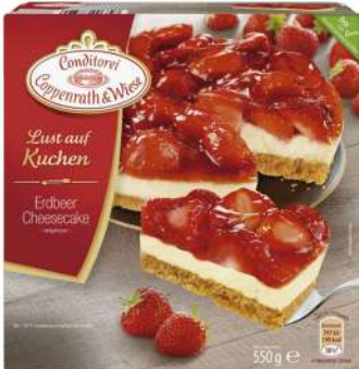
Cheesecake con fresas 900g