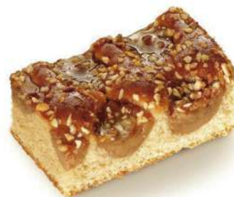
Caramelo y avellanas 2000g