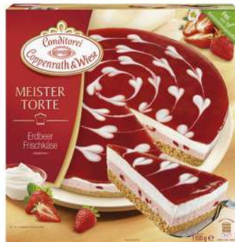
Queso y fresa 1100g