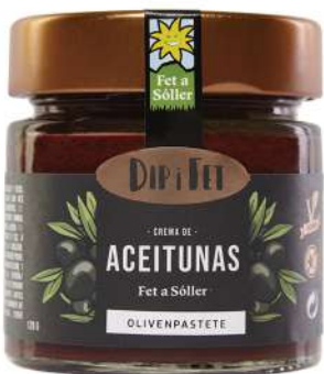
8436015964556 Crema de aceituna negra Dip i Fet 120g