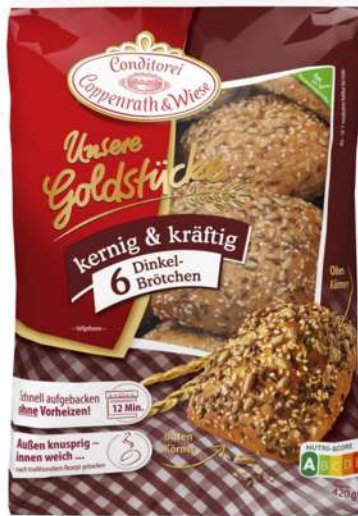
Con semillas 6 uds