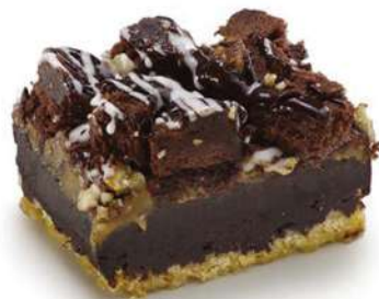
Rocky road 2760g